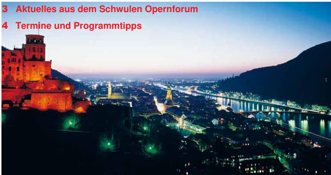
Abb.: Schlossruine Heidelberg bei Nacht mit Blick über Stadt und Neckartal